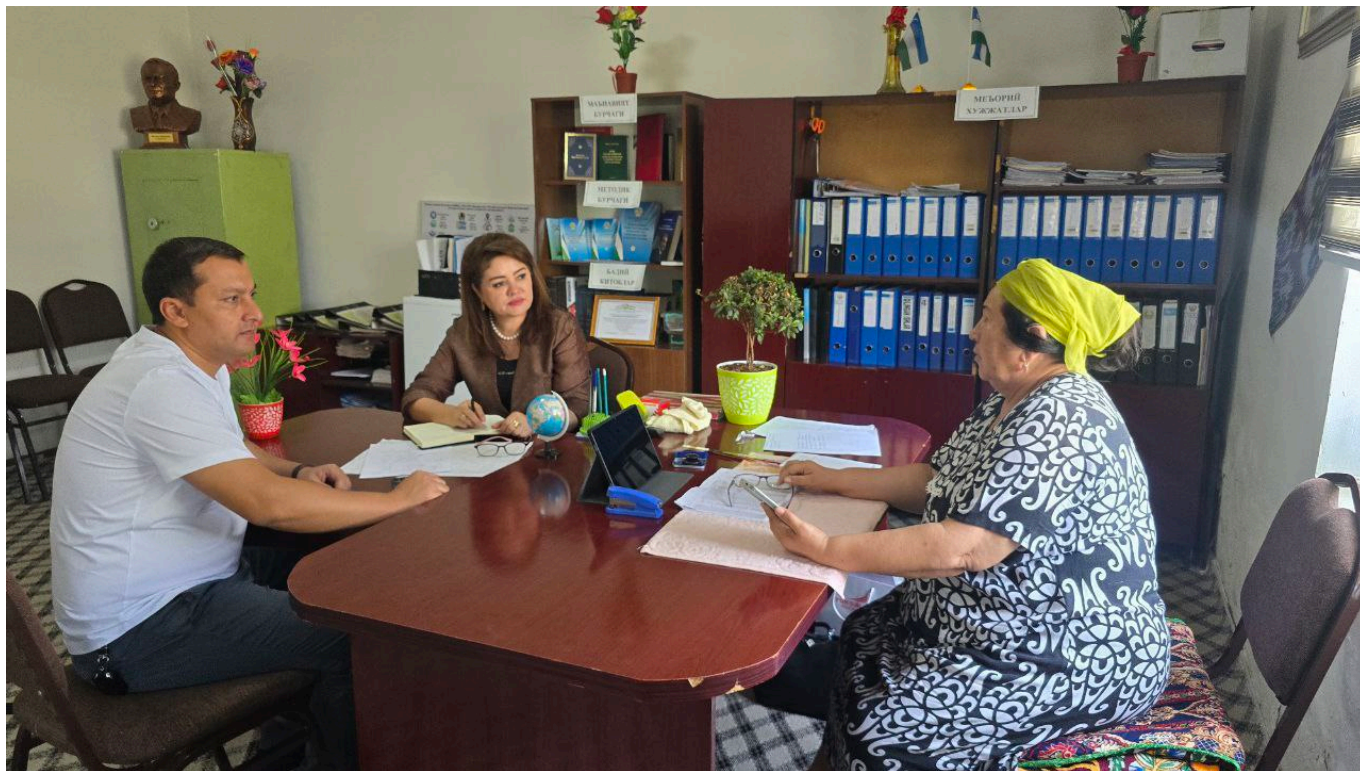
"Ўзкимёсаноат" АЖ мазкур ҳудудларда амалга оширилаётган ислоҳотларни янада самарали ва тизимли ташкил этишда ҳамкорликни давом эттиради.