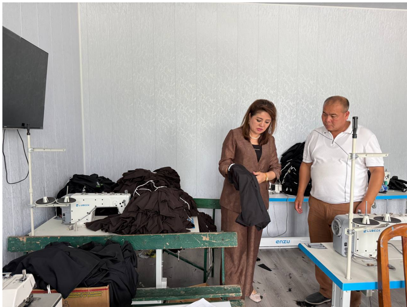
"Ўзкимёсаноат" АЖ Матбуот хизмати