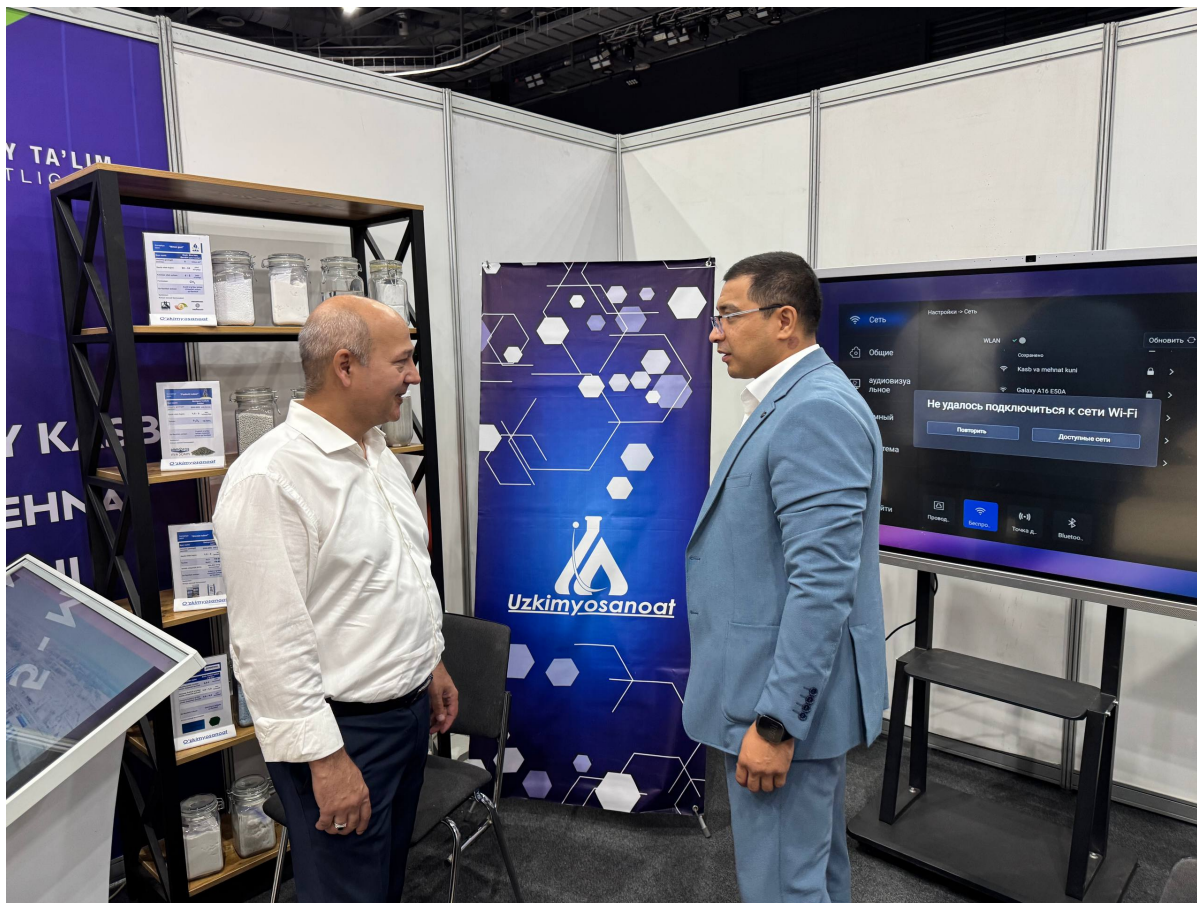
Компания вакиллари ёшларга кимё саноатидаги замонавий йўналишлар, иш ўринлари ва