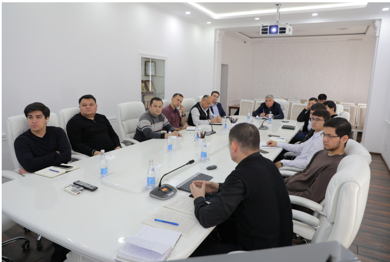
Пресс-служба АО «Узкимёсаноат»