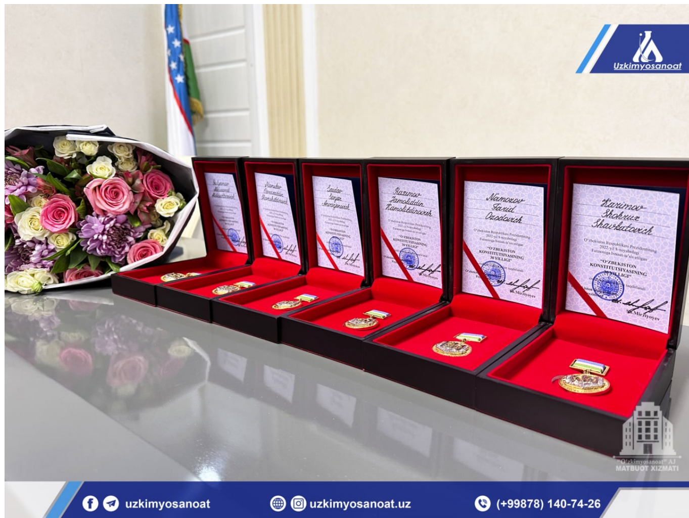
“O`zkimyosanoat” AJ Matbuot xizmati