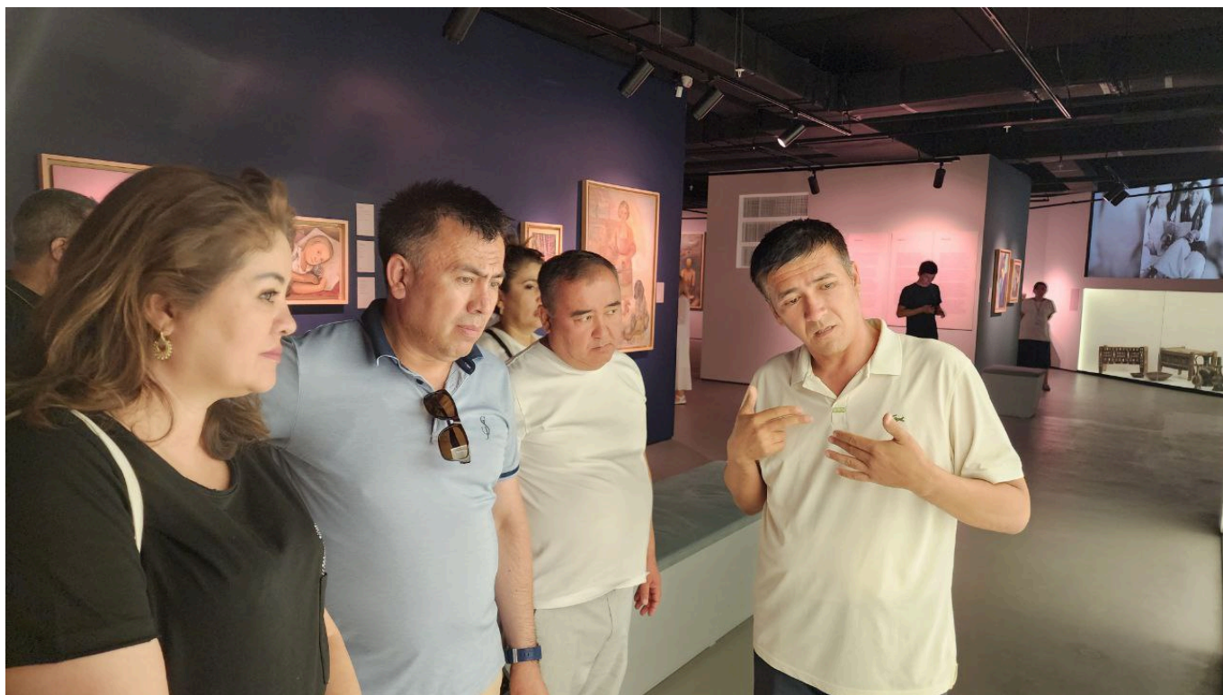
"O'zkimyosanoat" AJ Matbuot xizmati