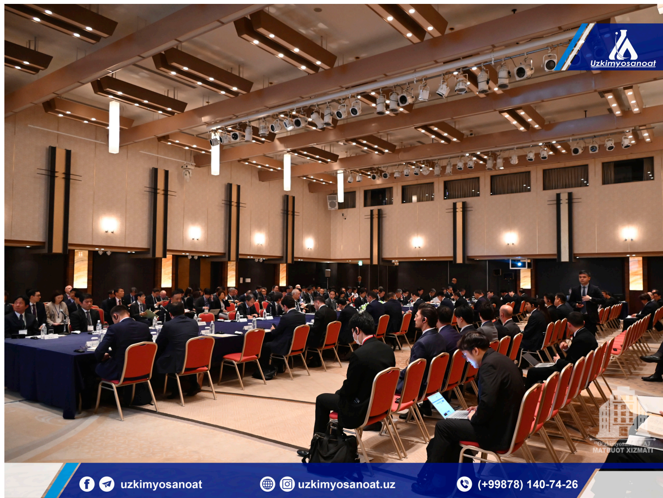
"O'zkimyosanoat" AJ Matbuot xizmati