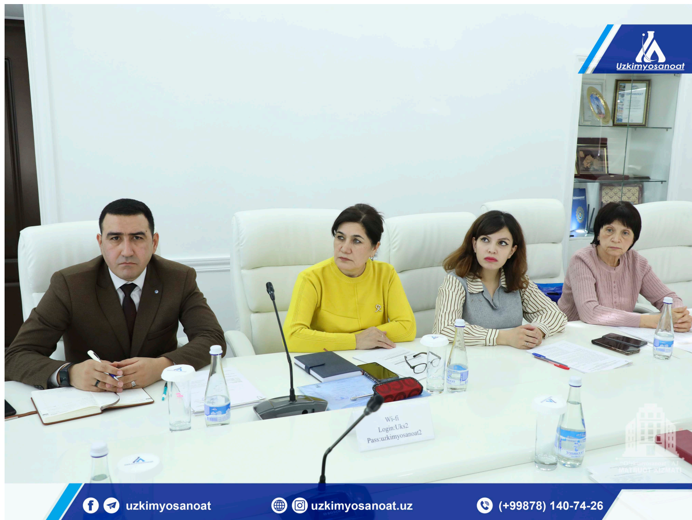
"O'zkimyosanoat" AJ Matbuot xizmati