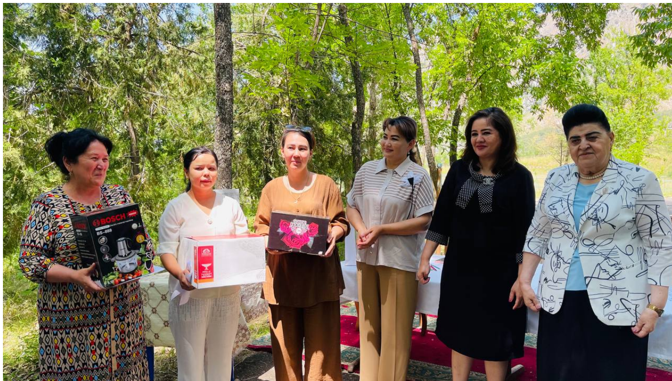
"Ammofos-Maxam" AJ Axborot xizmati